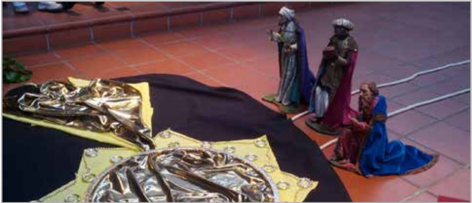
Gottesdienst mit Kindern in St. Michael / Kreuzberg

Auch 2021 bringen die Sternsinger als Heilige Drei Könige den Segen, nur ein wenig anders als gewohnt. „Segen bringen, Segen sein. Kindern Halt geben – in der Ukraine und weltweit“ lautet das diesjährige Leitwort. Das Dreikönigssingen ist die weltweit größte Solidaritätsaktion, bei der sich Kinder für Kinder in Not engagieren. Ca. 75.600 Projekte in Afrika, Lateinamerika, Asien, Ozeanien und Osteuropa wurden durch die Spendenaktion bisher unterstützt. Sie wird getragen vom Kindermissionswerk ‚Die Sternsinger‘ und vom Bund der Deutschen Katholischen Jugend (BDKJ).