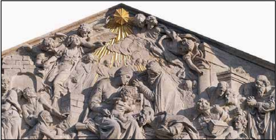
Anbetung der Heiligen Drei Könige

Das Giebelfeld der St. Hedwigs-Kathedrale ist mit dem Hochrelief des Bildhauers Nikolaus Geiger (1850-1897) ausgefüllt. Es zeigt die Anbetung der Heiligen Drei Könige in neobarocker Stilauffassung. Das Relief wurde 1773 angelegt, damals waren nur Bossenquader gesetzt und einzelne Figuren im Ansatz erkennbar.