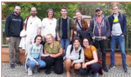
Einige BewohnerInnen der Studierenden-WGs

Für die meisten begann das Semester erst am 01.11., viele haben nur Online-Kurse. Aber trotz der besonderen Umstände entsteht ein wirkliches Gemeinschaftsleben. Natürlich werden wir dieses Jahr einiges an die sanitäre Situation anpassen müssen, aber auf jeden Fall werden wir einen