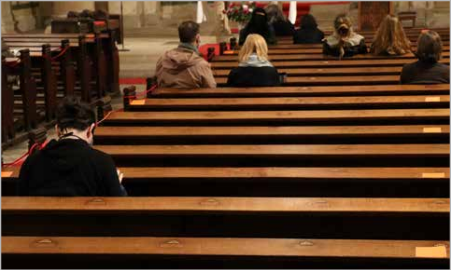
Corona Regeln einhalten – Abstand halten