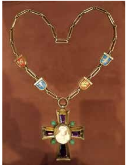
Die Amtskette des amtierenden Dompropstes, in die auch der Name Bernhard Lichtenberg auf der Rückseite eingraviert ist.