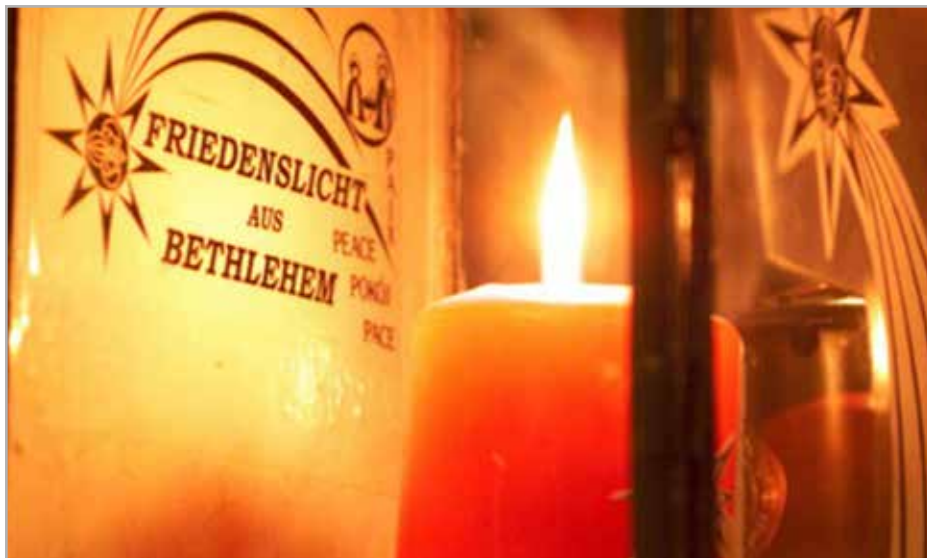
von Jugendfeuerwehr Reutte